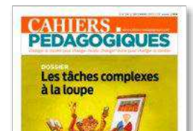
N° 541 - Les tâches complexes à la loupe